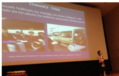
φωτο.: στιγμιότυπο από την τελετή βράβευσης των ΣΥ από το Δ. Αγ. Αναργύρων -Καματερού